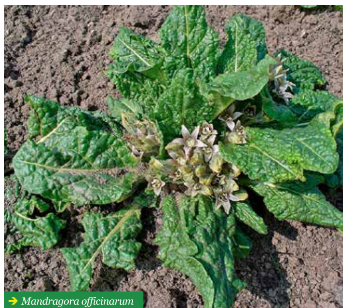
→ Mandragora officinarum

La mandragora contiene alcaloidi ed è altamente velenosa, perciò deve essere utilizzata soltanto da coloro che hanno un'esperienza adeguata. Attualmente ha una scarsa importanza farmacologica.