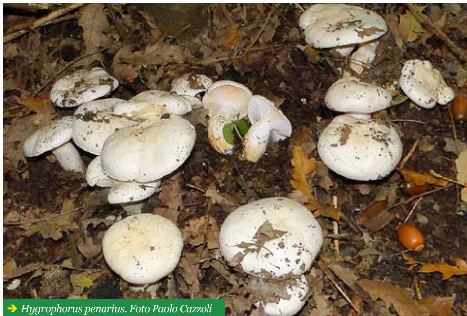
→ Hygrophorus penarius .

Si può confondere con altri igrofori bianchi. Le specie più comuni che crescono negli stessi ambienti di H. penarius sono H. eburneus e H. cossus , entrambi più gracili, di taglia normalmente inferiore, vischiosi almeno nel gambo e con un odore completamente diverso, sgradevole: non sono commestibili.