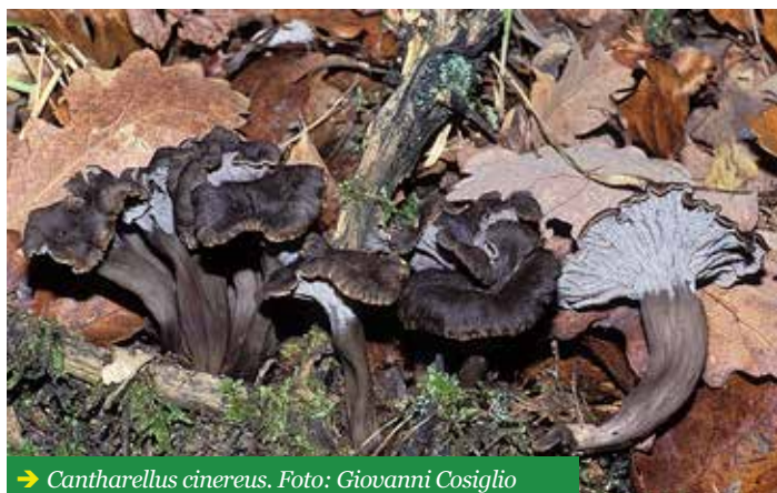
→ Cantharellus cinereus .