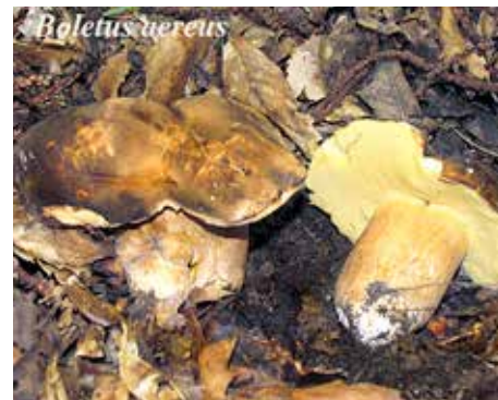
Boletus aereus Bulliard: Fries Nome volgare: Porcino nero, Bronzino

Per molti è il porcino più pregiato per il forte profumo che emana soprattutto da secco e per il dolce sapore di nocciola.