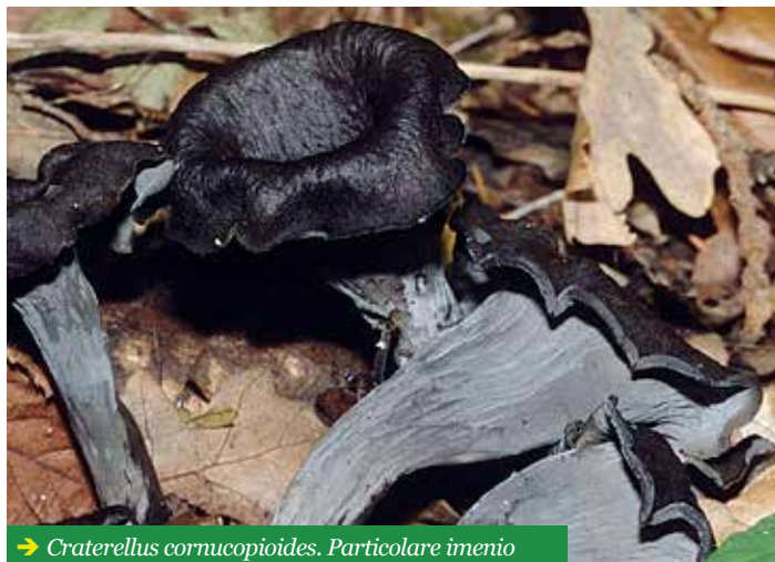
→ Craterellus cornucopioides . Particolare imenio