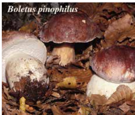
Boletus pinophilus Pilát & Dermek Nome volgare: Porcino rosso

Particolare ambiente di crescita: B. carpinaceus Velenovsky, cresce presso carpino bianco, B. edulis fo. articus Vasilikov, cresce nelle zone dell'estremo nord, B. edulis var. arenarius Engel, Krieglsteiner & Dermek, cresce sotto pini su suolo sabbioso. Alcune di queste specie sono state saltuariamente segnalate in Italia ( B. personii e B. venturii ) delle altre non si hanno notizie certe.