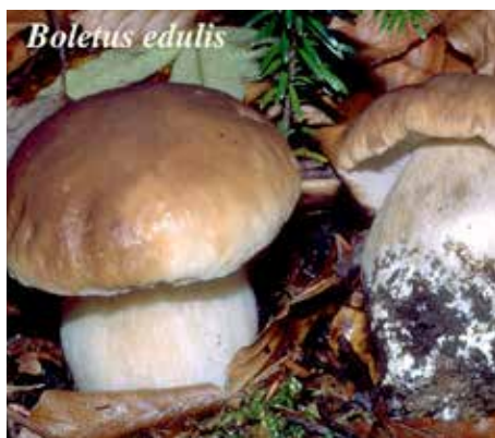
Boletus edulis Bulliard: Fries Nome volgare: Porcino

Tutte le specie di questo raggruppamento sono ottime commestibili perciò molto ricercate e di alto valore commerciale; commestibili anche da crude ma non da tutti tollerate. In Italia sono conosciute 4 specie e alcune varietà o forme.