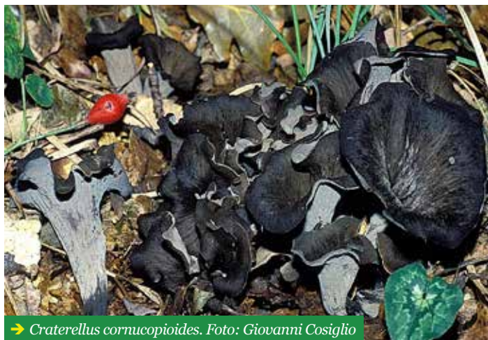
→ Craterellus cornucopioides .

L'unico fungo con cui si può confondere è Cantharellus cinereus , anch'esso commestibile ma di colore grigio, con la carne più soda e, cosa molto importante, con il gambo pieno e non "cavo", con l'immenoforo non liscio ma percorso da creste e pseudolamelle molto evidenti. Se il tempo è piovoso tutto l'immenoforo diviene nerastro e ricoperto da fini squamette.