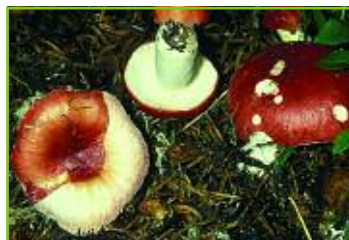
Russula nana con cuticola separabile