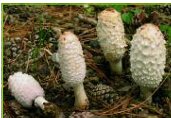
Coprinus comatus con cuticola squamosa

La parte che ricopre il cappello prende il nome di cuticola. La cuticola può essere liscia o presentare delle ornamentazioni; queste possono essere innate, cioè non asportabili, o riportate, cioè asportabili. Indipendentemente dalle ornamentazioni la cuticola può essere glabra o più o meno vellutata fino a lanosa-squamosa, o pruinoso. La pruina che ricopre la cuticola è solitamente bianca e asportabile. Per finire, la cuticola può essere asciutta o viscida fino a glutinosa. Questa caratteristica deve essere valutata con tempo normale, cioè non piovoso e non secco.