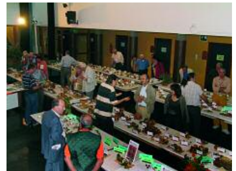
Mostra di Bologna

scana, che ha visto parecchi partecipanti e molti funghi, è stato molto apprezzato. Anche il Pranzo Sociale ha avuto un buon successo di partecipanti e di qualità gastronomica: ottima anche l'idea di noleggiare un pullman per chi non può o gradisce poco viaggiare in macchina. L'apoteosi sono stati gli auguri che ci siamo fatti l'ultimo lunedì utile di dicembre. Fra un po' inizia il nuovo anno micologico e spero che ci troveremo in tanti all'Assemblea Ordinaria del 29 gennaio 2007.