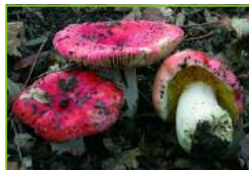
Russula luteotacta di solito di un bel rosso presenta anche la forma completamente bianca