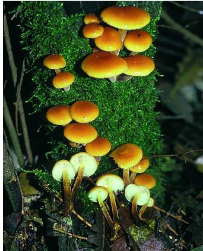
Flammulina velutipes

co), col cappello molto più carnoso, non così viscido, le lamelle giallo-verdognole e il gambo provvisto di anello e non vellutato. Armillaria tabescens (commestibile) può assomigliare, ma presenta un cappello non viscido e colori meno vivaci.